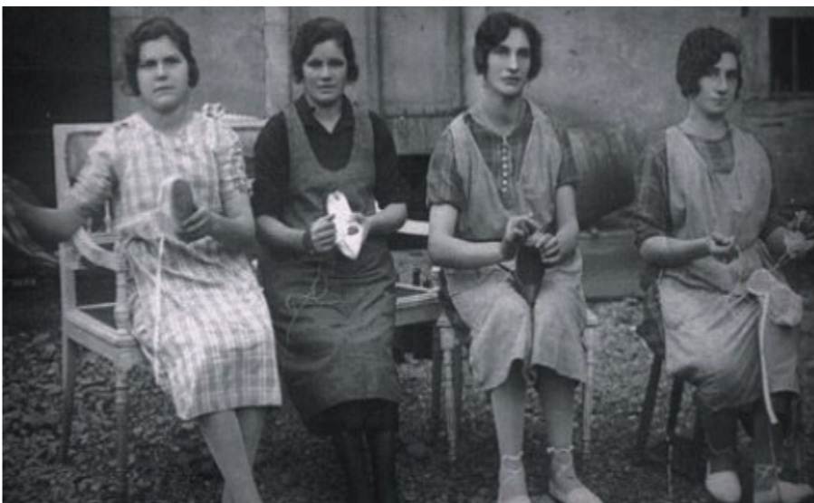
Revista La Kukula, 2018