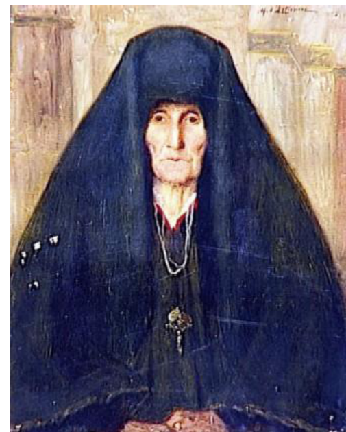
Henry D'Estienne. Vieille femme d'Aragon, Espagne Óleo sobre cartón. París, Musée d'Orsay