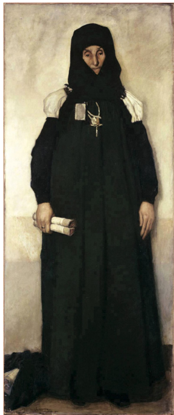
William Laparra, 1901. Museo de Bellas Artes de Burdeos