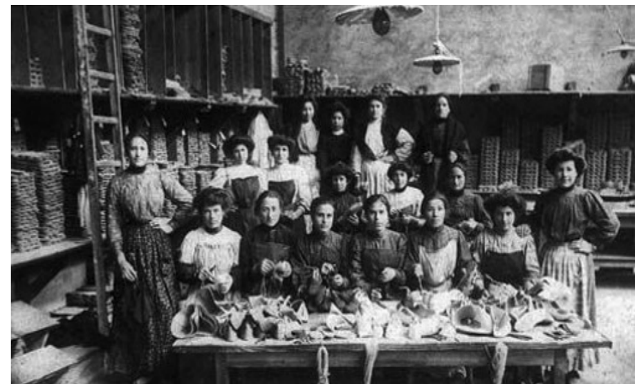
Revista La Kukula, 2018