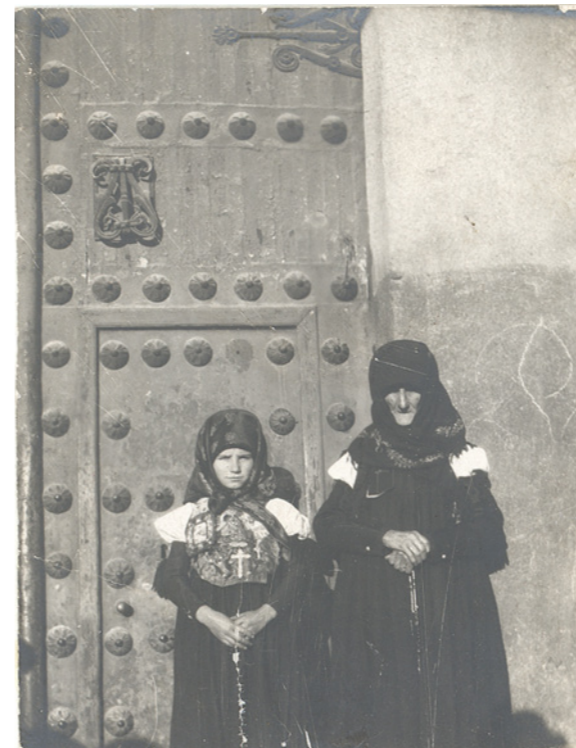
En la puerta del Convento de las Descalzas (Madrid)