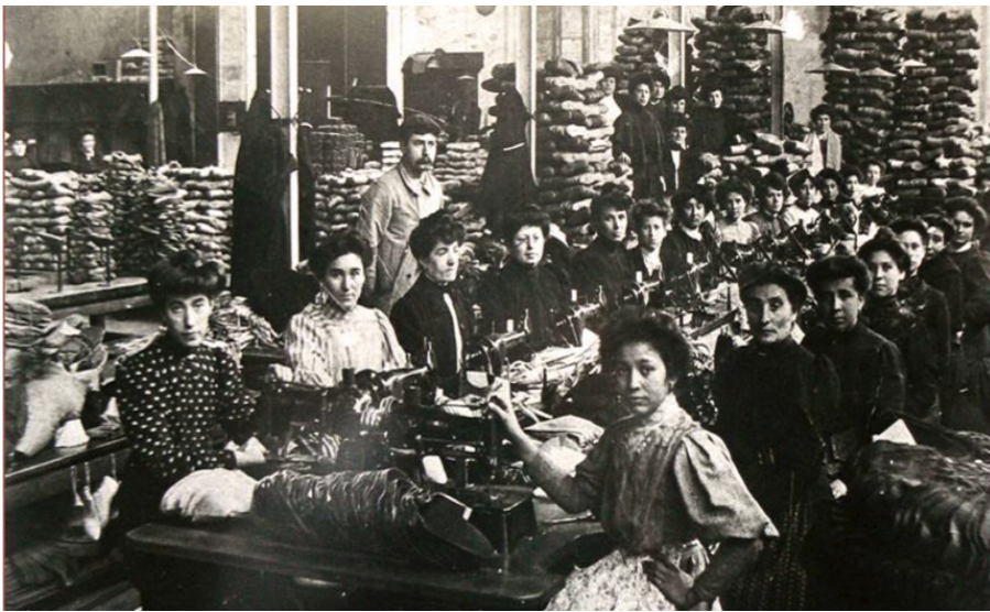
1905. Taller de Cherbero (Mauleón)