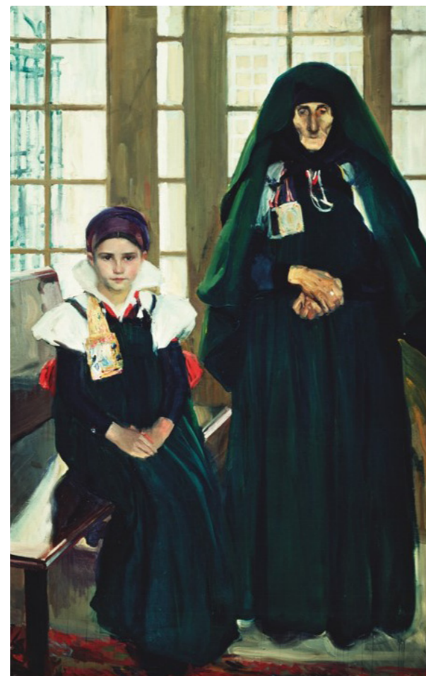
Joaquín Sorolla, 1911. Abuela y nieta Óleo sobre lienzo. Museo Sorolla de Madrid.